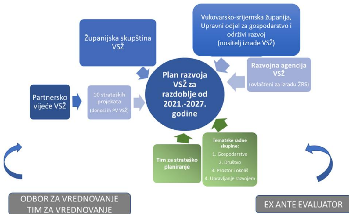
Slika 1. Prikaz institucionalnog okvira izrade Plana razvoja Vukovarsko-srijemske županije za razdoblje 2021. – 2027. godine